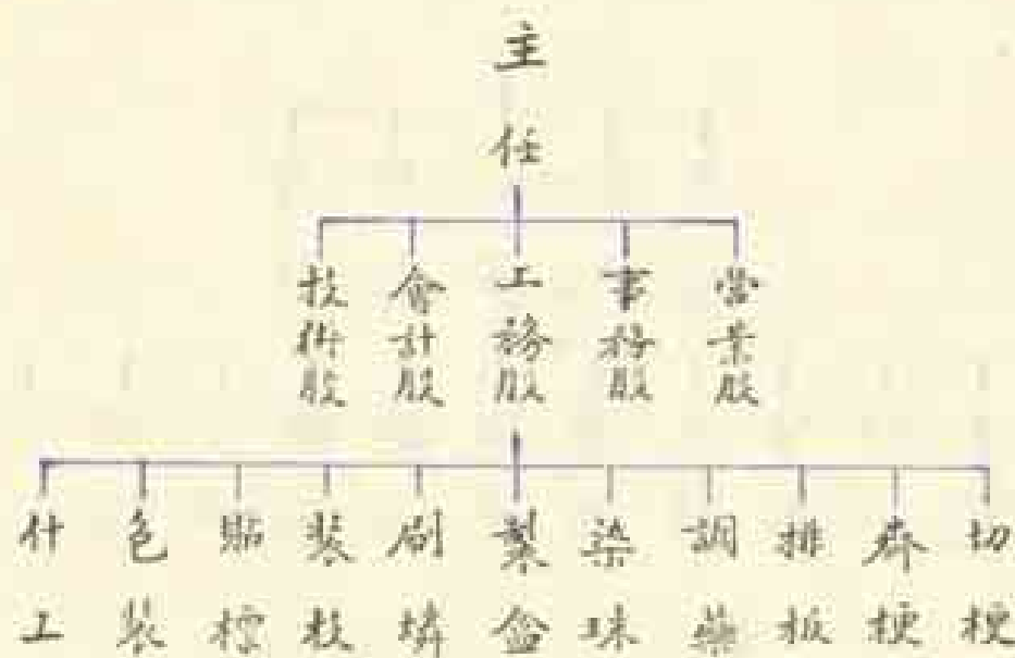
表三 星火火柴廠組織系統表

新生火柴廠規模最小。近年來很不景氣，時常停工，並且轉換了好幾個廠主。在組織上亦是將隨就簡的。全廠職員祇有經理一人負責營業方面的事務；主任一人管理廠務；技師一人負責解決技術上的問題，並且兼管工人。