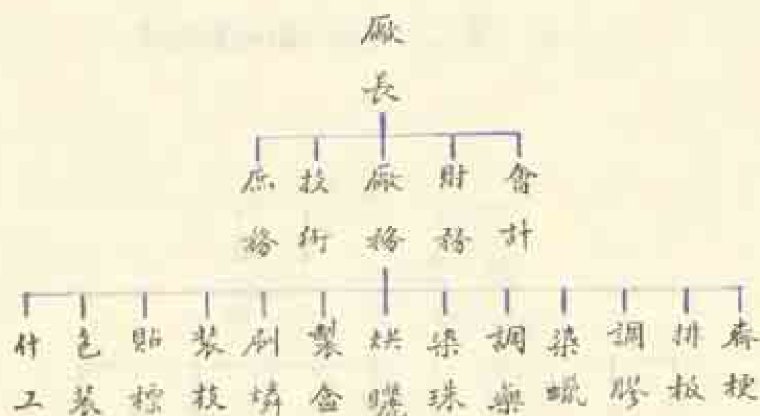
表四 看渡大藥廠組織系統表

財務和會計五股各設主任一人。工場分舂梗、排板、調膠、染蠟、調藥、染珠、烘曬、製盒、刷楨、裝技、貼標、色裝和什工十三部。各部有領工一人，由廠務股督導工作。